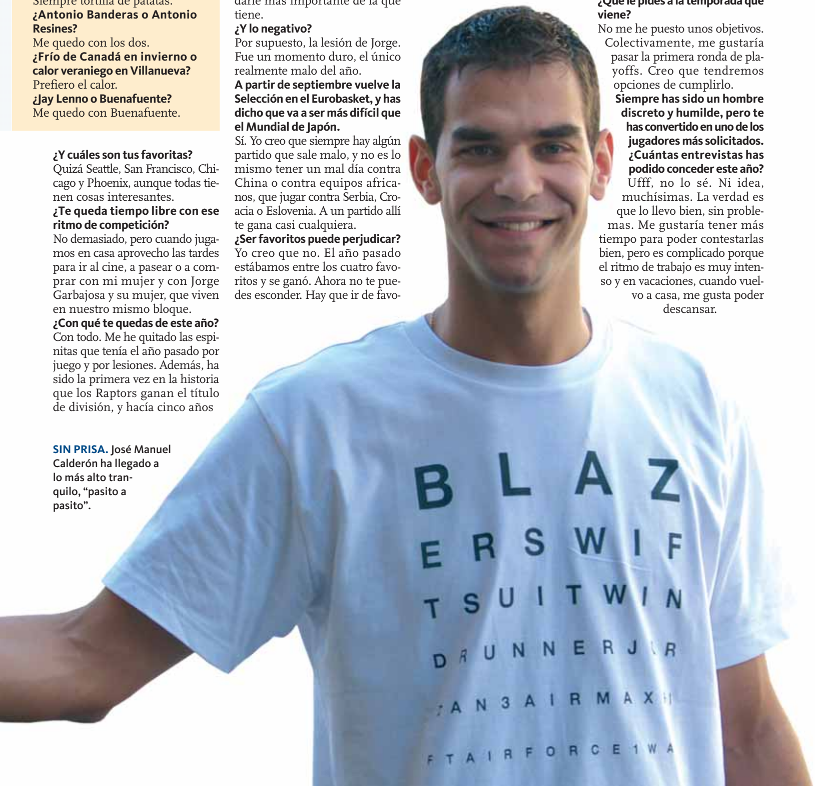
SIN PRISA. José Manuel Calderón ha llegado a lo más alto tranquilo, "pasito a pasito".

Ufff, no lo sé. Ni idea, muchísimas. La verdad es que lo llevo bien, sin problemas. Me gustaría tener más tiempo para poder contestarlas bien, pero es complicado porque el ritmo de trabajo es muy intenso y en vacaciones, cuando vuelvo a casa, me gusta poder descansar.